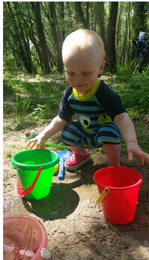
Kinder beim Forschen und Experimentieren mit Wasser