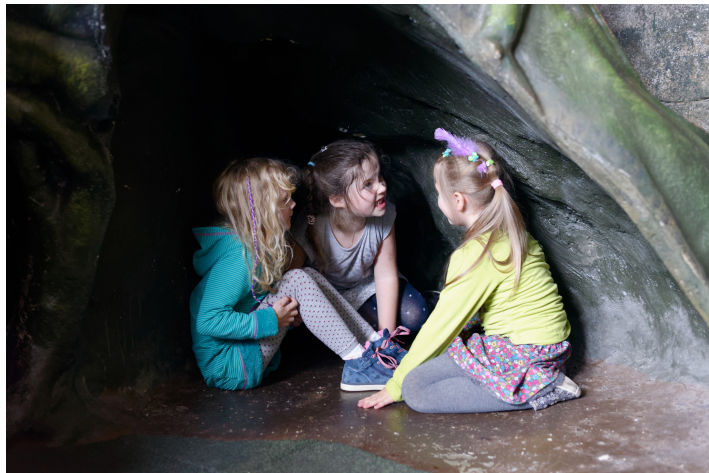
Beim Klettern oder Verstecken nehmen die Kinder verschiedene Perspektiven ein